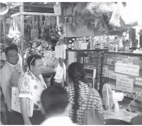
များတွင် တိုင်ကြားစာလက်ခံပုံးထားရှိပြီး လက်ခံညှိနှိုင်းဖြေရှင်း ဆောင်ရွက်နေမှု အခြေအနေများကို အကျယ်တဝင့် ဟောပြောဆွေး နွေးခဲ့ပါသည်။

ဧရာဝတီတိုင်းဒေသကြီး ပုသိမ်ခရိုင်စားသုံးသူရေးရာ ဦးစီးဌာန မှ တာဝန်ရှိသူများသည် အောက်တိုဘာလ ၉ ရက်တွင် ပုသိမ်မြို့ အမှတ်(၉)အထက်တန်းကျောင်းသို့ သွားရောက်၍ စားသုံးသူကာ ကွယ်ရေး အသိပညာပေးဟောပြောပွဲကို အဆိုပါကျောင်းအစည်း အဝေးခန်းမတွင် ကျင်းပပြုလုပ်ခဲ့ရာ ကျောင်းသူ/ကျောင်းသား၊ ဆရာ / ဆရာမများစုစုပေါင်း ၅၀၀ ဦးခန့် တက်ရောက်ခဲ့ကြပါသည်။ ဟောပြောပွဲတွင် ပုသိမ်ခရိုင်စားသုံးသူရေးရာ ခရိုင်ဦးစီးမှူးက စားသုံး သူရေးရာဥပဒေအကြောင်း၊ ဌာနမှ ကျောင်းသူကျောင်းသား များ အပါ အဝင် စားသုံးသူများ ဘေးအန္တရာယ်ကင်းရှင်းစွာစားသောက် သုံးစွဲနိုင်ရေးအတွက်ဌာနမှဆောင်ရွက်ပေးနေမှုများ၊ ပြည်သူလူထု အားလုံးပူးပေါင်းဆောင်ရွက်နိုင်ရန် ကျောင်းမှန်ဈေးတန်းစားသုံးသူ ရေးရာအဖွဲ့များ၊ ဈေးစားသုံးသူရေးရာအဖွဲ့များ၊ ရပ်ကွက် စားသုံးသူ ရေးရာအဖွဲ့များ ဖွဲ့စည်းပြီး ဈေးကွက်ရောက်ကုန်ပစ္စည်းများ၊ ဈေး ကွက်မရောက်မီ ကုန်ပစ္စည်းများအား စားသုံးသူရေးရာဦးစီးဌာန၊ အငြင်းပွားမှုအဖွဲ့ များနှင့် ပူးပေါင်းစစ်ဆေးဆောင်ရွက်နေမှုများ၊ စားသုံးသူများ နစ်နာဆုံးရှုံးမှုရှိပါက တိုင်ကြားနိုင်ရန် စားသုံးသူ တိုင်ကြားမှုလက်ခံဆောင်ရွက်ရေးအတွက် ကျောင်း၊ ဈေး၊ ရပ်ကွက်