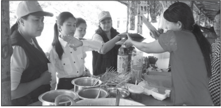
သူ့အကာအကွယ်ပေးရေးဥပဒေနှင့် အညီ သတ်မှတ်ချက်များနှင့် ကိုက်ညီမှု မရှိသော စားသောက်ကုန်ပစ္စည်းများ ကိုရောင်းချခြင်းမပြုရန် ဝန်ခံကတိရေး ထိုးစေခြင်း ပြုလုပ်ခဲ့ပါသည်။ ထို့နောက် ဈေးဆိုင်ပိုင်ရှင်များ

ကော့သောင်းခရိုင်၊ စားသုံးသူ ရေးရာဦးစီးဌာနနှင့် မိတ်ဖက်အဖွဲ့များ ပူးပေါင်း၍ အောက်တိုဘာ ၁၆ ရက် မှစ၍ ကော့သောင်းမြို့ပေါ်ရှိ ကျောင်း ပရဝုဏ်ပြင်ပတွင် ရောင်းချနေသော ဆိုင်များတွင် စားသုံးရန်မသင့် အန္တရာယ် ရှိ စားသောက်ကုန်များ ရောင်းချခြင်း ရှိ/မရှိ ကွင်းဆင်းစစ်ဆေးခဲ့ရာ မှီတက် သက်တမ်းလွန် စားသောက်ကုန်များ စစ်ဆေးတွေ့ရှိရသဖြင့် ထုတ်ကုန် လုံခြုံ စိတ်ချရမှုမရှိသော စားသောက်ကုန် ပစ္စည်းများကို သိမ်းဆည်းခဲ့ပြီး စားသုံး