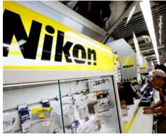
Nikon ကော်ပိုရေးရှင်းမှ တာဝန်ရှိသူတစ်ဦးက ပြောကြားခဲ့သည်။ Nikon ကော်ပိုရေးရှင်းသည် ဂျပန်နိုင်ငံနှင့် ထိုင်းနိုင်ငံတို့တွင် ဒစ်ဂျစ်တယ်ကင်မရာနှင့် ဆက်စပ်ပစ္စည်းများထုတ်လုပ်လျက်ရှိသည်။

တွင် ဖော်ပြထားသည်။ ကင်မရာနှင့်ဆက်စပ်ပစ္စည်းများ ထုတ်လုပ်သည့်စက်ပစ္စည်းများကိုမူ ထိုင်းနိုင်ငံရှိ Nikon စက်ရုံအပါအဝင် အခြားသော Nikon များသို့ လွှဲပြောင်းပေးမည်ဖြစ်သည်ဟုဆိုသည်။ Nikon ကော်ပိုရေးရှင်းသည် ၂၀၁၆ ခုနှစ် နိုဝင်ဘာလက တည်းက ၎င်းတို့ကော်ပိုရေးရှင်းအနေဖြင့် ပြုပြင်ပြောင်းလဲမှုများကို ပြုလုပ်မည်ဖြစ်ကြောင်း ထုတ်ဖော်ကြေညာထားပြီးဖြစ်သည်။ Nikon ကော်ပိုရေးရှင်းအနေဖြင့် နောက်ဆုံးပေါ်ခေတ်မီသည့်ဒစ်ဂျစ်တယ်ကင်မရာများကိုထုတ်လုပ်ပြီး ဈေးကွက်တွင် ယှဉ်ပြိုင်နိုင်စွမ်းရှိသည့် ကင်မရာများအား ထုတ်လုပ်နိုင်ရန် ကြိုးစားသွားမည်ဖြစ်သည်ဟုဆိုသည်။ “ပြီးခဲ့တဲ့နှစ်တွေက စမတ်ဖုန်း ထုတ်လုပ်မှုတွေမြင့်တက်လာခဲ့ပါတယ်။ အဲဒီလိုမြင့်တက်လာတဲ့အတွက် ဒစ်ဂျစ်တယ်ကင်မရာတွေရဲ့ဈေးကွက်က ကျဆင်းလာခဲ့ပါတယ်။ တရုတ်နိုင်ငံရဲ့ဈေးကွက်မှာ နေရာယူထားတဲ့ Nikon အမှတ်တံဆိပ်ကင်မရာရဲ့ ဈေးကွက်တောင်းဆိုမှုက ထူးထူးခြားခြားကျဆင်းခဲ့ပါတယ်။ ဒါဟာ စီးပွားရေးပတ်ဝန်းကျင်တစ်ခုမှာ ခက်ခဲတဲ့ယှဉ်ပြိုင်မှုတစ်ခုဖြစ်ပါတယ်”ဟု