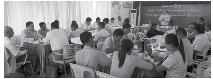
သွားရန်နှင့် မြို့နယ်များတွင်လည်း မှာဖြစ်ကြောင်း ပြောကြားခဲ့ပါသည်။ အသိပေးဆက်လက်ဆောင်ရွက်သွားသန်းအေး (စားသုံးသူ)

ခရိုင်အငြင်းပွားမှု ပြေရှင်းရေးအဖွဲ့ဥက္ကဋ္ဌ ဦးထွန်းဝေက စားသုံးသူအငြင်းပွားမှု ပြေရှင်းရေးအဖွဲ့အနေဖြင့် လမ်းညွှန်မှုအပေါ် လိုက်နာဆောင်ရွက်