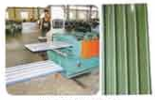
4 ANGLE DESIGN