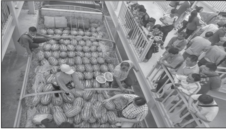
နေကလျာခိုင်(မူဆယ်)

ဖရဲသီးသည် နိုင်ငံခြားဝင်ငွေရှာဖွေပေးနေ သော မြန်မာ့သစ်သီးဝလံတစ်မျိုးဖြစ်ပြီး ကုန်စိမ်း သီးနှံ ဖြစ်သည့်အတွက် ဝယ်လိုအားက ရောင်း လိုအားထက်ပိုလျှင် ဈေးတက်၍ ရောင်းလိုအားက ဝယ်လိုအားထက်ပိုလျှင် ဈေးကျသည်မှာ သဘာဝ ဖြစ်ပါသည်။ မြန်မာနိုင်ငံတွင် ဖရဲသီးများကို ယခင် က ရာသီစာ သီးနှံအဖြစ်သာ စိုက်ပျိုးကြသော်လည်း ယခုအခါ တစ်နှစ်ပတ်လုံး စိုက်ပျိုးလျက်ရှိတဲ့ သီးနှံ ဖြစ်ပါတယ်။ အချို့ဒေသတွေမှာတော့ ကြားသီးနှံ အဖြစ် စိုက်ပျိုးလျက်ရှိပါတယ်။ ဖရဲသီးများကို တပ်ကုန်း၊ ရန်ကုန်၊ ကျောင်းကုန်း၊ မိတ္ထီလာ၊ မြင်းခြံ၊ ခရမ်း၊ ကုမဲ၊ ကျောက်ဆည် ဒေသများတွင် စိုက်ပျိုး ကြပါသည်။ တောင်သူများအနေဖြင့် ဖရဲသီးစိုက် ပျိုးခြင်းကြောင့် မိမိဒေသအတွင်း အလုပ်အကိုင် များရရှိပြီး ဝင်ငွေများလည်းရရှိကြောင်း သိရှိရပါ သည်။ ဖရဲထွက်ရှိရာ ဒေသအလိုက် အရည်အသွေး ပေါ်မူတည်၍ ဈေးကောင်းပေးဝယ်ကြပြီး နေပြည် တော်၊ တပ်ကုန်း၊ ဖရဲသီးထက် ကလေး၊ တမူးမှ ထွက်ရှိသော ဖရဲသီးများကို ပိုမို နှစ်သက်ကြ ကြောင်း သိရပါသည်။ မြစ်သား၊ တံတားဦး၊ ကျောက်ဆည်၊ ဝမ်းတွင်း၊ မိတ္ထီလာ၊ မြင်းခြံ၊ သာစည် မြို့များမှလည်းဖရဲသီးအထွက် ကောင်းကြောင်း သိရပါသည်။ ဖရဲသီးမှာရိုးရိုးနှင့် အစေ့မဲ့ဟူ၍ နှစ်မျိုးရှိရာ ယခုအရောင်းအဝယ်လိုက်၍ ဈေးကောင်း ရလျက်ရှိသော ဖရဲအမျိုးအစားမှာ အစေ့မဲ့ဖရဲသီး ဖြစ်ကြောင်း သိရပါသည်။ ၂၀၁၆-၂၀၁၇ ဘဏ္ဍာနှစ်ဒီဇင်ဘာလ ၁ ရက်မှ ၂၆ ရက်ထိ ဖရဲသီးတင်ပို့မှုမှာ အမေ