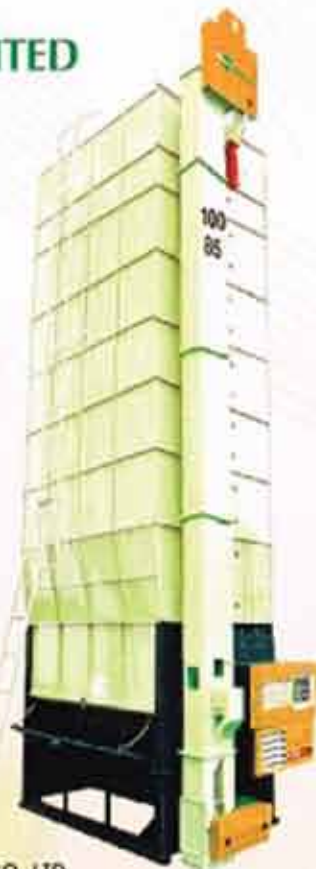
Grain Dryer (HSD-100SD) 10 MT per Operation

အမှတ်(၁၀၀)၊ ဝါးတန်းလမ်းနှင့် ကမ်းနားလမ်းထောင့်၊ ကွန်ကရစ်အမြန်လမ်းမဘေး၊ ဝါးတန်းဆိပ်ကမ်းဧရိယာ၊ ဆိပ်ကမ်းမြို့နယ်၊ ရန်ကုန်တိုင်းဒေသကြီး။ ဖုန်း - ၀၁ ၂၃၀၁၆၅၂ ~ ၅၃ E-mail - admin@mapco-ygn.com