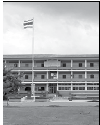
နိုင်ငံခြားရှိ/မရှိ အကဲဖြတ်ရန် သက်ဆိုင်ရာ အာဏာပိုင်များအား ညွှန်ကြားထားပြီးဖြစ်ပါသည်။

ထိုင်းနိုင်ငံ၏ National Alcoholic Beverage Policy Commission သည် ပညာရေးအဖွဲ့ အစည်းများ/ ကျောင်းနှင့်တက္ကသိုလ်များ၏ မိတာ ၃၀၀ ပတ်လည်တွင် အရက်၊ ဘီယာနှင့် အဖျော်ယမကာများ ရောင်းချမှု ရပ်ဆိုင်းရန် ကြေညာချက်မူကြမ်းကို ဇူလိုင်လ ၁၀ ရက်နေ့၌ အတည်ပြုခဲ့ကြောင်း သိရှိရပါသည်။